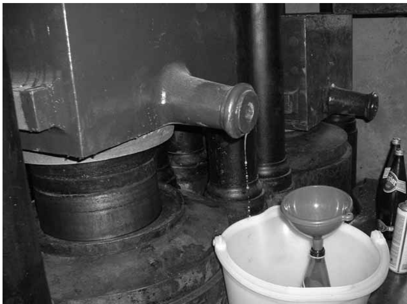
Revel Dialogue N° 62