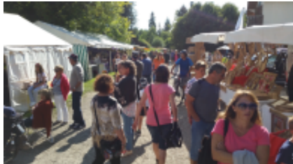
Fête de Freydières

Avant de complètement basculer en 2018, retrouvez en détail sur notre page du site Internet de Revel les différents événements qui se sont déroulés en 2017.